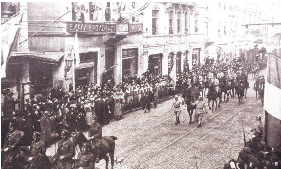
İstanbul'u işgal eden Fransız General d'Espèrey'nin Fatih'in fetih törenini anımsatan tören yürüyüşü.

Yetmemiş, İtilaf Devletlerin kontrolündeki Padişah Vahdettin ve Sadrazam Damat Ferit hükümeti 10 Ağustos 1920'de "devleti bitiren" Sevr Antlaşması'nı imzalamışlardır.