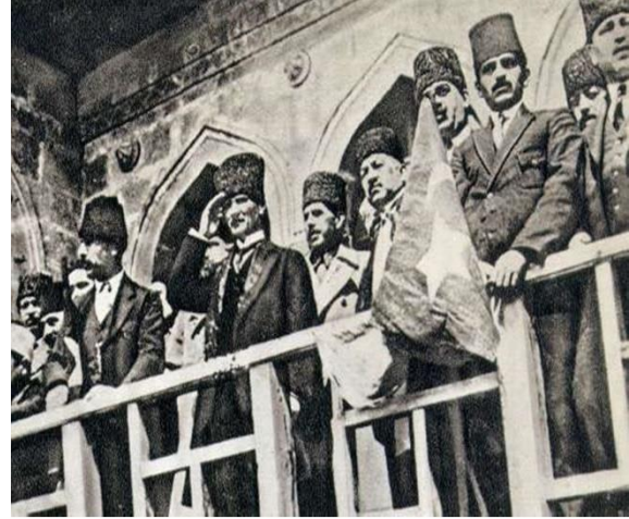
Bu topraklarda artık savaş bitmiştir! (10 Eylül 1922 Hükümet Konağı – İzmir)

2. Marmara ve Trakya bölgesi kurtarılmıştır: Tek kurşun atılmadan, İstanbul ve tüm bölge kurtarılmıştır!