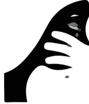
Kadına deniyor ki: “Hala konuşuyor, sen yoksun, sus!”