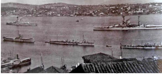
1915'te Çanakkale'yi geçemeyen İtilaf Devletleri donanması 1918'de İstanbul'da.

Orduları dağıtılmış, başkenti işgal edilmiş, padişahı-yönetenleri kontrol edilen bir devletin varlığından söz edilemez.