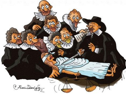
Bilim de adalet de kadının yanında mı?