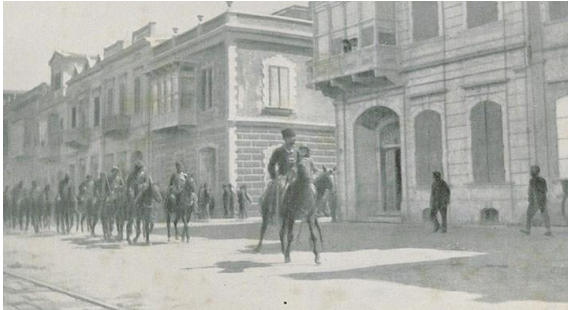
Fahrettin Altay Paşa komutasındaki Süvari Bölüğü İzmir'de!

1. 9 Eylül ülkenin “kurtuluş günü”dür: O gün yalnızca İzmir değil, aynı zamanda Rize'den Mersin'e Hakkari'den Edirne'ye Erzurum'dan Konya'ya tüm ülke kurtulmuştur!