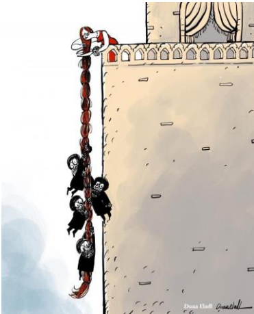
Medeni yasalarında, aile hukukunda, miras hukukunda, ceza hukukunda “kadını kuleye hapsedmek!”