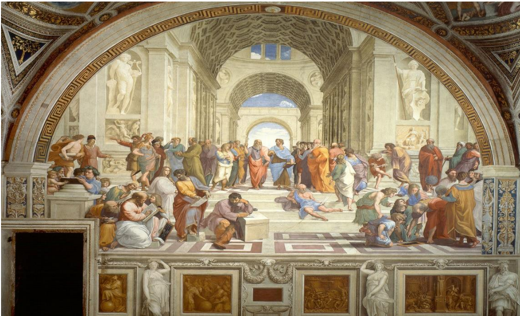
“FELSEFE ya da ATINA OKULU” - Raffaello Sanzio (Antik Çağdan 15.yüzyıla... Düşünürler)

“Hiç kimse görmek istemeyen kadar kör değildir”. İbn-i Sina