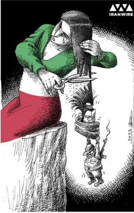
Kadına, saçından baskı uygulamak!