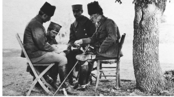
Başkomutan Mustafa Kemal Paşa, Batı Cephesi Komutanı İsmet (İnönü) Paşa ve Albay Asım (Gündüz) cephede savaş planı üzerinde çalışıyorlar (25 Ağustos 1922)