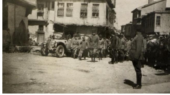
26 Ağustos 1922 öncesi Afyon Cephesi, hazırlık