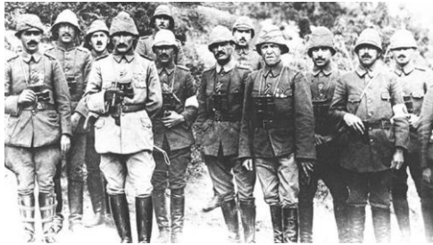
1915 - Çanakkale Savaşlarında,

"Hürriyet ve istiklal benim karakterimdir"