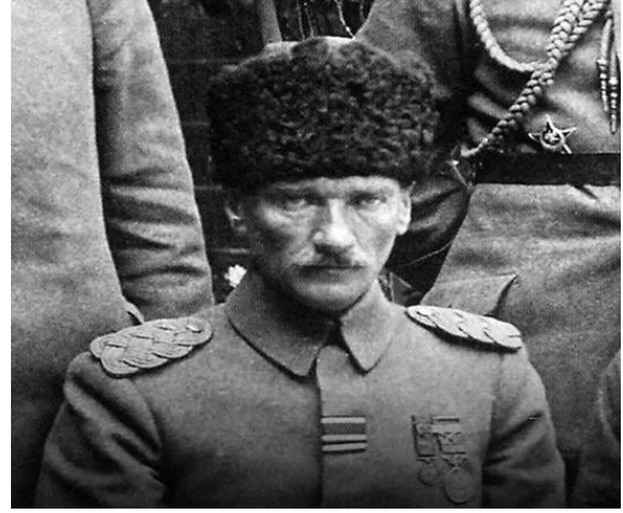
1916 - Kafkas Cephesi'nde