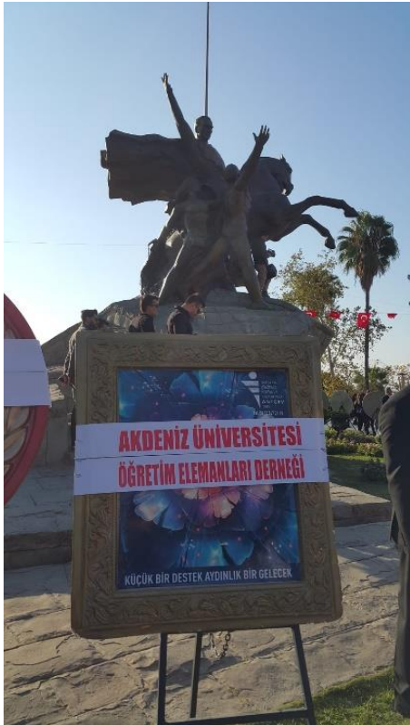
Akdeniz Üniversitesi Öğretim Elemanları Derneği olarak Cumhuriyet Alanı'nda törendeyiz (10 Kasım 2022)