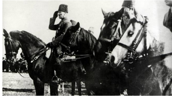
Başkomutan Mustafa Kemal Paşa, Orduları teftiş ediyor (26 Ağustos 1922 öncesi)

“Süngülerle, silahlarla ve kanla kazandığımız askeri zaferlerden sonra, kültür, bilim, fen ve ekonomi alanlarında da zaferler kazanmaya devam edeceğiz”.