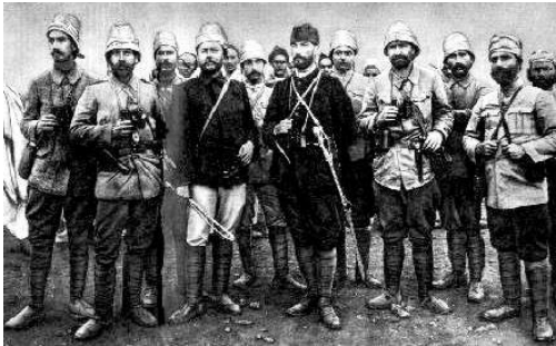
1911-1912 - Trablusgarp Cephesi'nde

Tek başına bu mücadele bile ömür boyu minnetle anılmasını gerektirir.