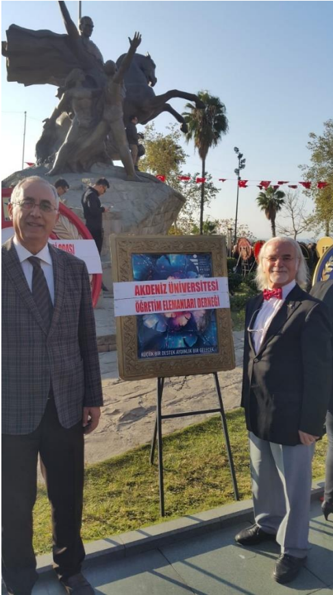
Akdeniz Üniversitesi Öğretim Elemanları Derneği olarak Cumhuriyet Alanı'nda törendeyiz (29 Ekim 2022)