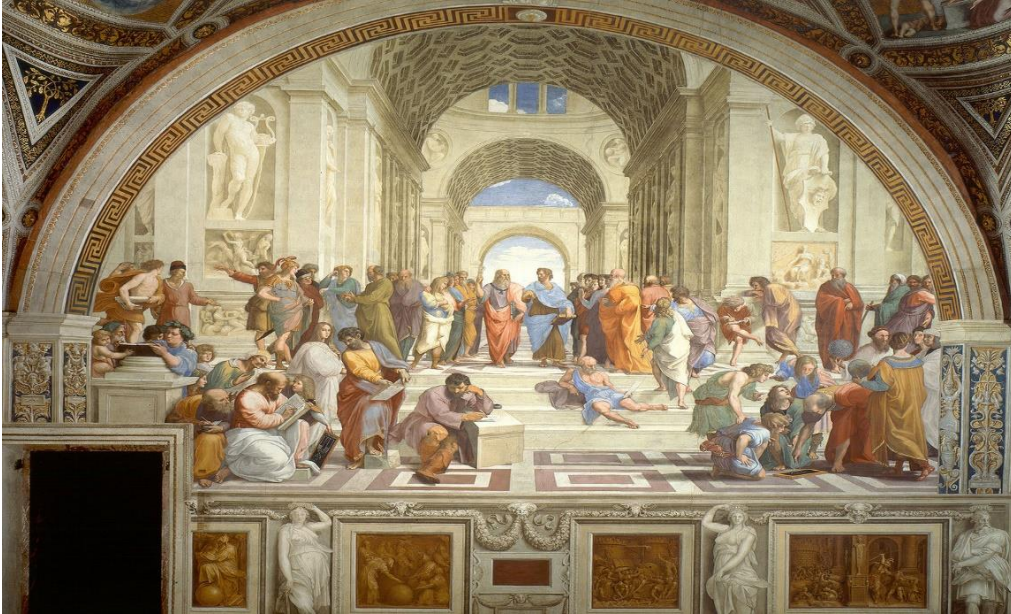
“FELSEFE ya da ATİNA OKULU” - Raffaello Sanzio (Antik Çağdan 15.yüzyıla... Düşünürler)

“Dünyada her şey için, medeniyet için, hayat için, muvaffakiyet için en hakiki mürşit ilimdir, fendir. İlim ve fennin haricinde mürşit aramak gaflettir, cehalettir, dalalettir”. Gazi Mustafa Kemal ATATÜRK