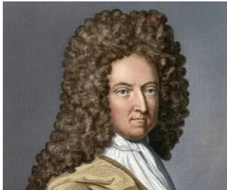
Daniel Defoe (1660 – 1731)